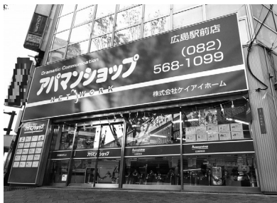
(株)ケイアイホーム 広島情報戦略部 〒732-0821 広島市南区大須賀町13-5田村ビル2F

女性は安心して働ける職場のモデルケースにしていきたい。今はネットで多くの情報を得る時代ですから、他社との差別化を図る為にも物件情報の充実が最も欠かせないコンテンツです。この部署では、AOSというシステムを駆使して、次々と入る新着情報を入力し、修正も行っていきます。この作業を迅速かつ正確にアップする為には、粘り強さと相当の集中力が必要で、一日の作業を終える頃にははぐつたりとしてしまう事が多々あります。(笑)